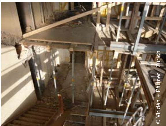
Rückbau Treppenhaus Feldbergstrasse 6

Durch die Modernisierung wird ein besserer Mix der Mieterstruktur erzielt. Zudem wird der Komfort gesteigert und die Energiekosten massiv reduziert.